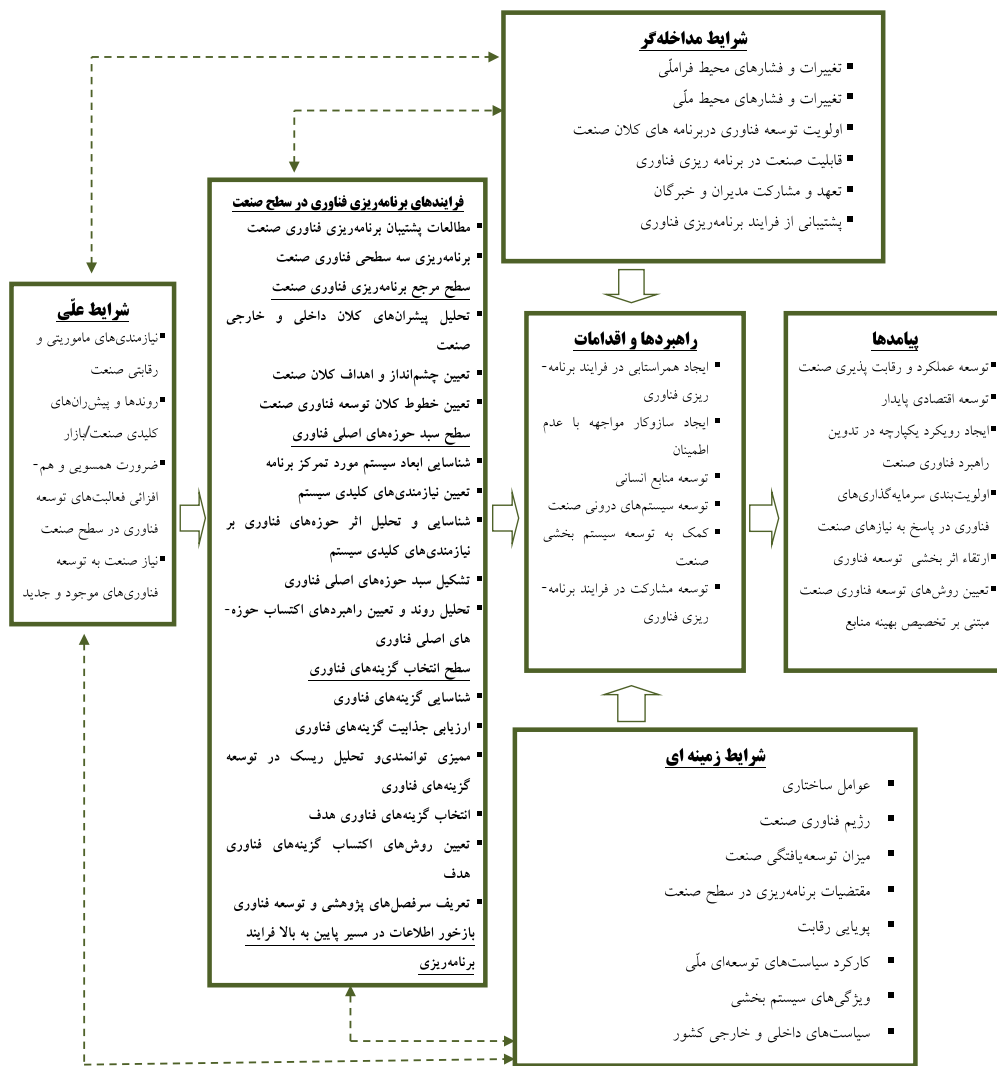
شکل (۱): مدل پارادایمی پدیده فرایند برنامه‌ریزی فناوری در سطح صنعت

نظام‌مند به سایر مقوله‌ها ارتباط می‌دهد، رابطه‌ها را اعتبار می‌بخشد و مقوله‌هایی که نیاز به پالایش و توسعه‌ی بیشتر دارند را توسعه می‌دهد [۴۲]. مدل نظری "برنامه‌ریزی فناوری در سطح صنعت" مطابق با ابعاد مدل پارادایمی در شکل (۱) قابل مشاهده است.