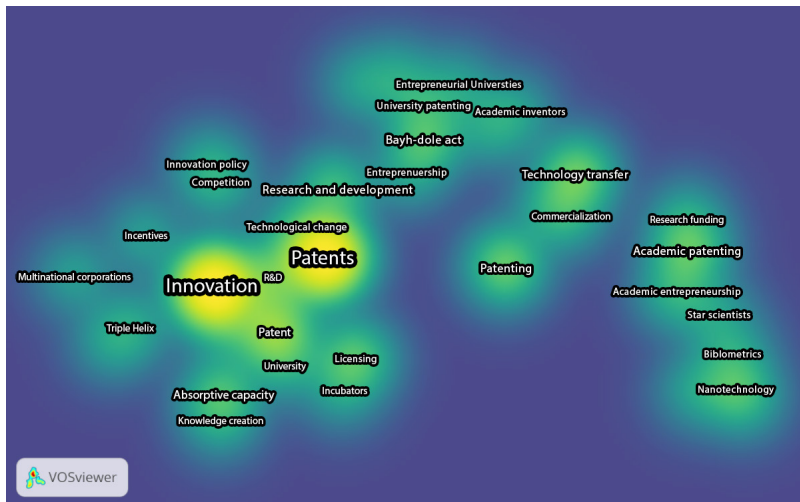
شکل (۲): چگالی کلمات کلیدی در مقاله‌های منتخب مرور شده