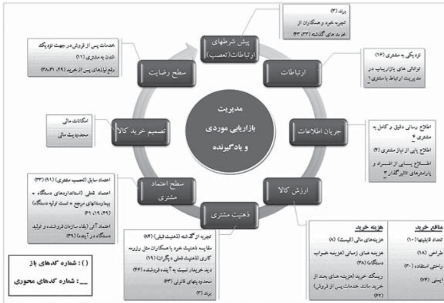
شکل (۲) مدل رفتار تصمیم گیری کالای فناوری برتر

و هزینه‌ها قائل هستند، متفاوت می‌باشد. از طرف دیگر، عوامل دیگری نظیر علامت تجاری که برآیند تصورات جامعه و فرد نسبت به یک شرکت خاص می‌باشد نیز بر ذهنیت مشتری تاثیر به سزایی خواهد داشت. این ذهنیت به تنهایی مشتری را از خرید کالایی دور نمی‌کند و به سوی کالای دیگر نمی‌کشاند بلکه در خرید کالاهای فناوری برتر، آنچه باعث تصمیم‌گیری خرید مشتری می‌شود، اعتماد به کالا و فروشنده است که ذهنیت یکی از مهم‌ترین عوامل ایجادکننده آن می‌باشد. اما فرآیند تصمیم‌گیری مشتری و بازاریابی فروشنده با انجام خرید، به پایان نمی‌رسد، بلکه رضایت مشتری زمانی حاصل می‌گردد که کیفیت کالا و خدمات خریداری شده، با سطح کیفی مورد انتظار وی، برابر باشد. در غیر این صورت باعث دلزدگی، سلب اعتماد و در نهایت کاهش میزان رضایت مشتری می‌گردد. این تغییر در سطح رضایت مشتری، منجر به تغییر نوع خرید مشتری در خریدهای آتی خواهد شد و لذا این مراحل به شکل چرخه ای بسته وجود خواهد داشت.