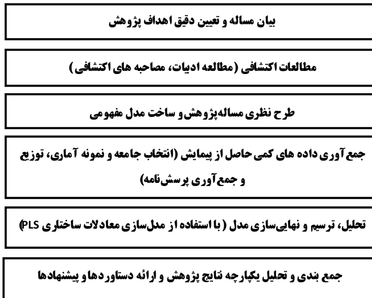
شکل (۲): مراحل پژوهش

در نهایت می توان مراحل طی شده در مرحله تجزیه و تحلیل آماری را شامل موارد زیر دانست: