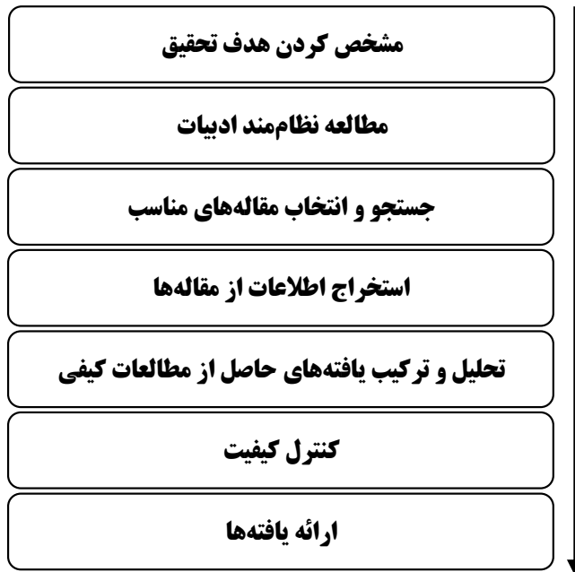
شکل (۱): مراحل روش فراترکیب (Sandelowski & Barroso, 2007)

نوآوری منطقه‌ای و ارائه تحلیل و تفسیر پیرامون آنها بر اساس ویژگی‌های آنهاست. در این تحقیق سعی بر آن است که بر اساس مطالعه پژوهش‌های پیشین، به ارائه تحلیلی عمیق از زمینه‌های اصلی شکل‌گیری مدل‌های نوآوری منطقه‌ای و ویژگی‌های آنها پرداخته شود و یک دسته‌بندی از مناطق بر اساس این مدل‌ها ارائه گردد.