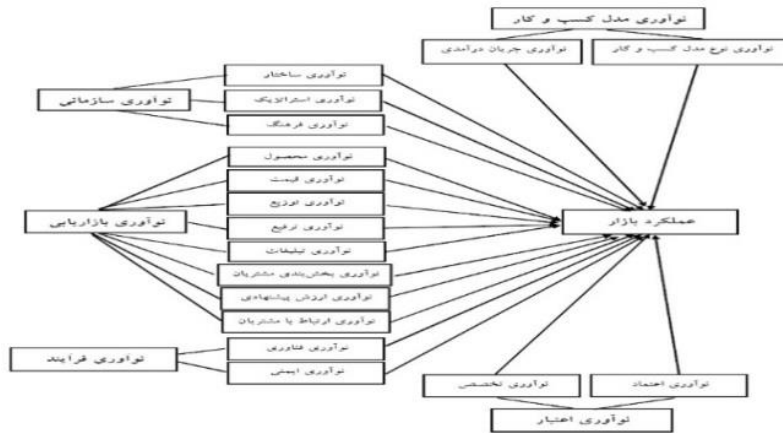
شکل ۲. الگوی مفهومی تأثیر ابعاد و زیرابعاد انواع نوآوری بر عملکرد وبگاه‌های مطرح خرید بر خط در کشور