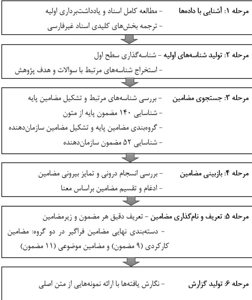
شکل ۱. روش تحلیل مضمون به شیوه براون و کلارک (۲۰۰۶)

مضمون به شیوه براون و کلارک شامل شش مرحله انجام شده است که در شکل ۱ قابل مشاهده است.