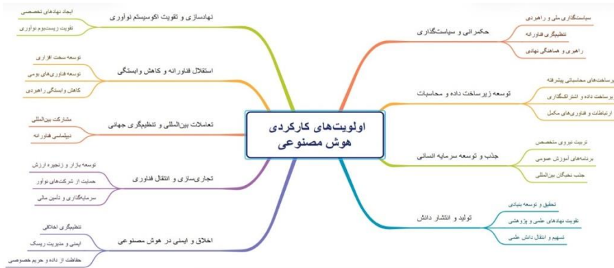
شکل ۲. اولویتهای کارکردی هوش مصنوعی در کشورهای منتخب

این شبکه مضامین که در شکل ۲ نمایش داده شده است، تصویری جامع از اولویتهای کارکردی کشورهای بررسی شده در حوزه هوش مصنوعی ارائه می دهد و می تواند مبنایی برای تصمیم گیری ها و سیاست گذاری های آتی باشد.