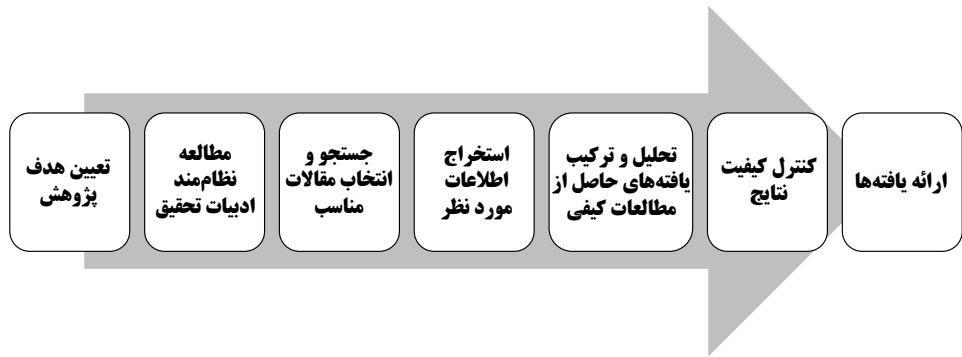
شکل (۱): مراحل روش فراترکیب (Sandelowski & Barroso, 2006)

میان اعضای شبکه‌های رسمی همکاری علم و فناوری است. در این پژوهش سعی بر آن است که بر اساس مطالعات پیشین، تحلیل عمیقی از عوامل مؤثر بر روابط بین اعضای شبکه‌های فوق صورت گرفته و یک دسته‌بندی از این عوامل بر اساس نظریه سرمایه اجتماعی ارائه شود.